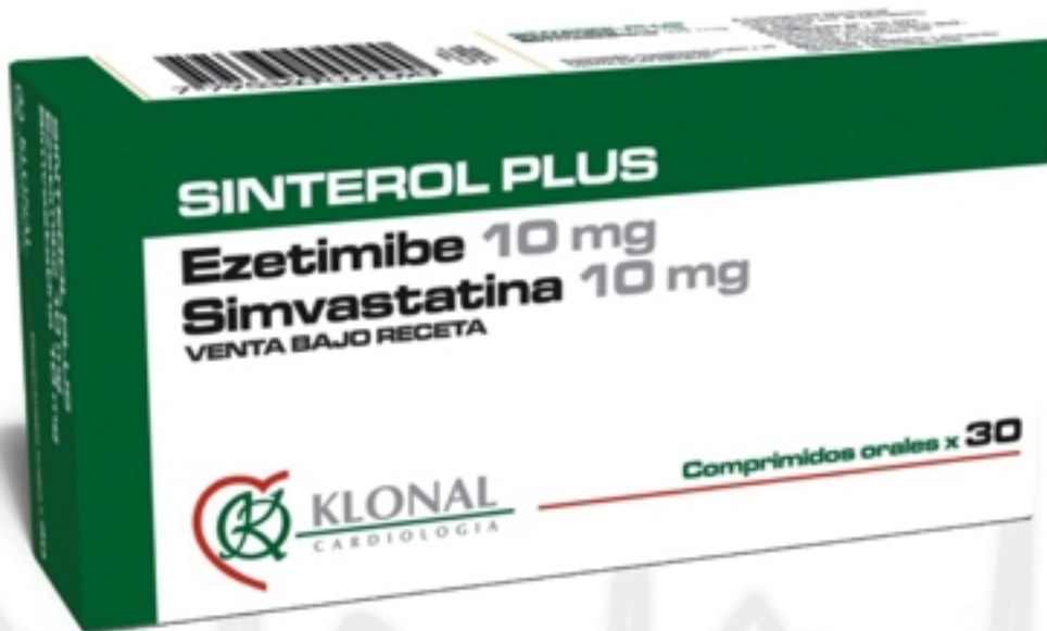
EZETIMIBE + SIMVASTATINA: RESULTADOS DE EFICACIA SOBRE LDL-C